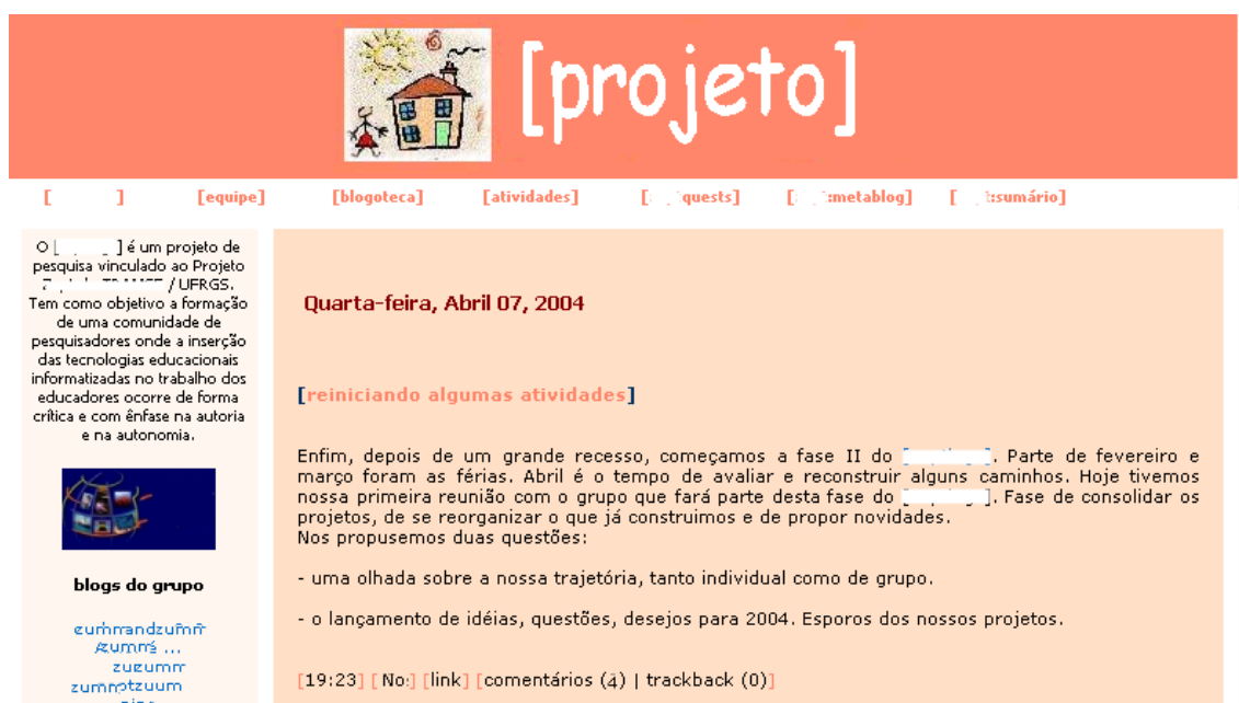
Figura 1 – aspecto geral do blog colaborativo do projeto, mostrando um post .

O que faz um weblog diferente de outras páginas e sítios é a facilidade com que podem ser criados, editados e publicados, sem que o criador tenha conhecimentos técnicos especializados. Um weblog é construído e colocado on-line por meio de um aplicativo que codifica, hospeda e publica a página. Estes aplicativos estão disponíveis na rede, em diversos tipos e em versões gratuitas ou não.